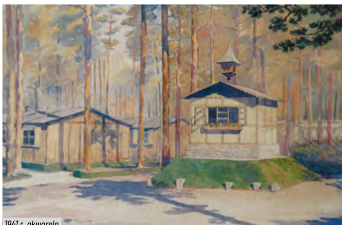
1941 r. akwarela

Waldlager szybko stał się celem akcji zbrojnych ze strony pobliskich placówek ZWZ-AK pomiędzy 1942 a 1944 rokiem. Wywieziono z obozu dużą ilość broni i amunicji, koniecznej do dozbrojenia oddziałów partyzanckich. Za przewodników często służyli robotnicy tam pracujący, doskonale obeznani z tym rozległym terenem. Okres II wojny światowej przyniósł duże zniszczenie majątku przedsiębiorstwa. Wybuchy licznych składów amunicji zniszczyły 50 ha lasów, uszkodziły w dużym stopniu elektrownię, budynki administracyjne, produkcyjne i mieszkalne. Tereny zakładu zostały częściowo zaminowane przez wycofujące się na zachód wojska niemieckie.