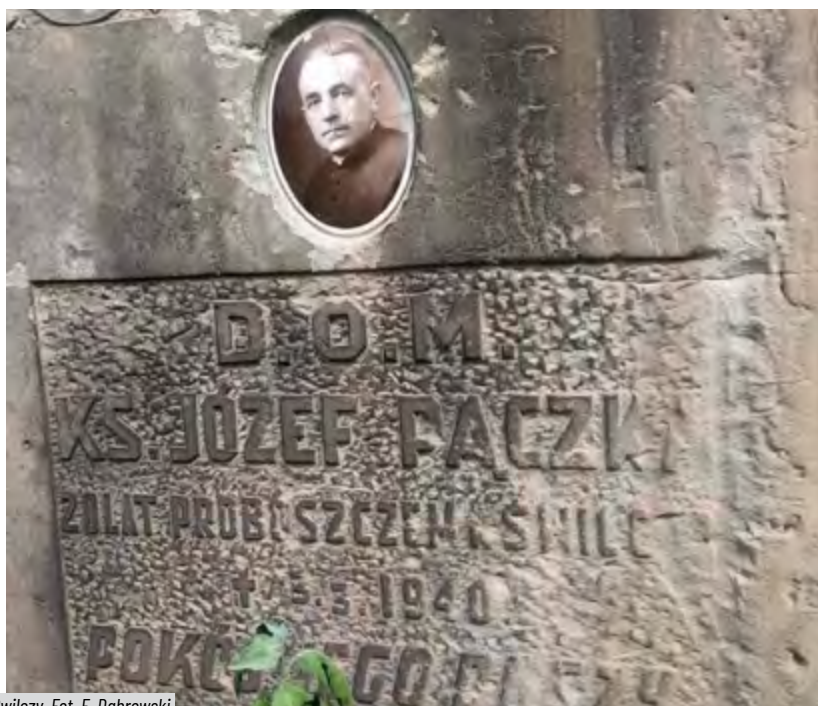
Zdjęcia przedstawiające grób księdza Józefa Pączki na cmentarzu parafialnym w Świlczy.