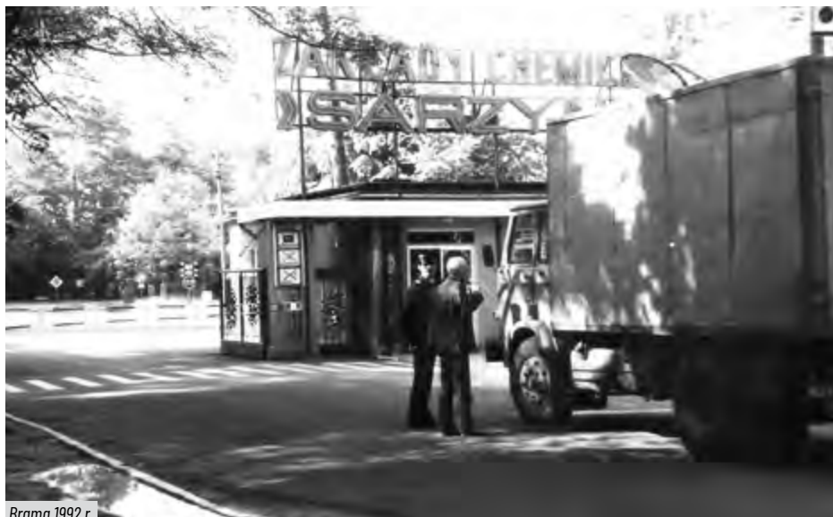
Brama 1992 r.