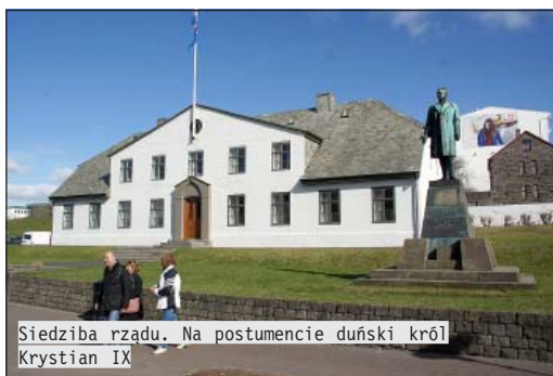
Siedziba rządu. Na postumencie duński król Krystian IX

go zamka w drzwiach, w oczekiwaniu na właściciela idziemy z plecakami w stronę dobiegającej, rytmicznej muzyki. To pierwszomajowy pochód. Czerwone szturmówki, islandzkie flagi i dęta orkiestra. Ponoć Islandczycy, wbrew przysłowiowej skandynawskiej oziębłości, uwielbiają pochody, pikniki i spotkania. A kiedy dzień staje się dłuższy, Reykjavik przeobraża się w miasto szalonej zabawy. Orientacja w mieście nie stwarza większych problemów, zważywszy, że z każdej strony widać wieżę najsłynniejszej budowli stolicy – Luterancką Świątynię Hallgrímskirkja. Kościół, budowano ponad 60 lat. Oddano go do użytku w 1986 roku i nadano mu imię pastora Petursona, słynnego na Islandii poety, twórcy psalmów i hymnów. Wjeżdżamy na dzwonnice, by podziwiać wspaniałą panoramę miasta. Z wysokości 75 metrów doskonale widać zlokalizowane praktycznie w samym centrum lotnisko krajowe, które poza połączeniami z innymi miastami Islandii obsługuje także loty na Grenlandię. Południową panoramę miasta zdominował Perlan. To ogromne metalowe zbiorniki z wodą pochodzącą z gorących źródeł używaną do ogrzewania miasta. Na placu przed świątynią stoi pomnik Leifura Eiríkssona który około tysięcznego roku dotarł do wybrzeży Ameryki Północnej, dokładnie dzisiejszego Labradoru i Nowej Funlandii, blisko 500 lat przed Kolumbem.