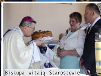
Biskupa witają Starostowie