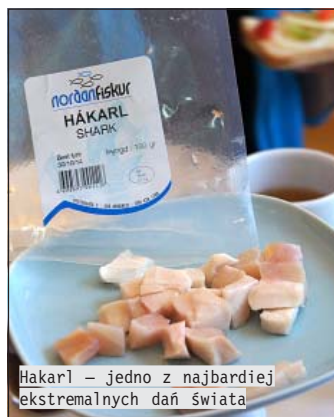
Hakarł – jedno z najbardziej ekstremalnych dań świata