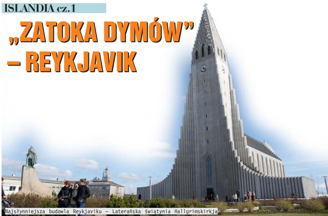
Najsłynniejsza budowla Reykjavíku – Laterańska Świątynia Hallgrímskirkja

Islandia to nie tylko wspaniała natura. To kraj niezwykle pod wieloma względami. Na przykład nazwiska Islandczyków są tworzone od imienia ojca. Po narodzinach rodzice nadają dziecku imię, a nazwisko tworzy się dołączając do imienia ojca końcówkę oznaczającą syna (son) lub córkę (dottir). W ten sposób w rodzinie złożonej