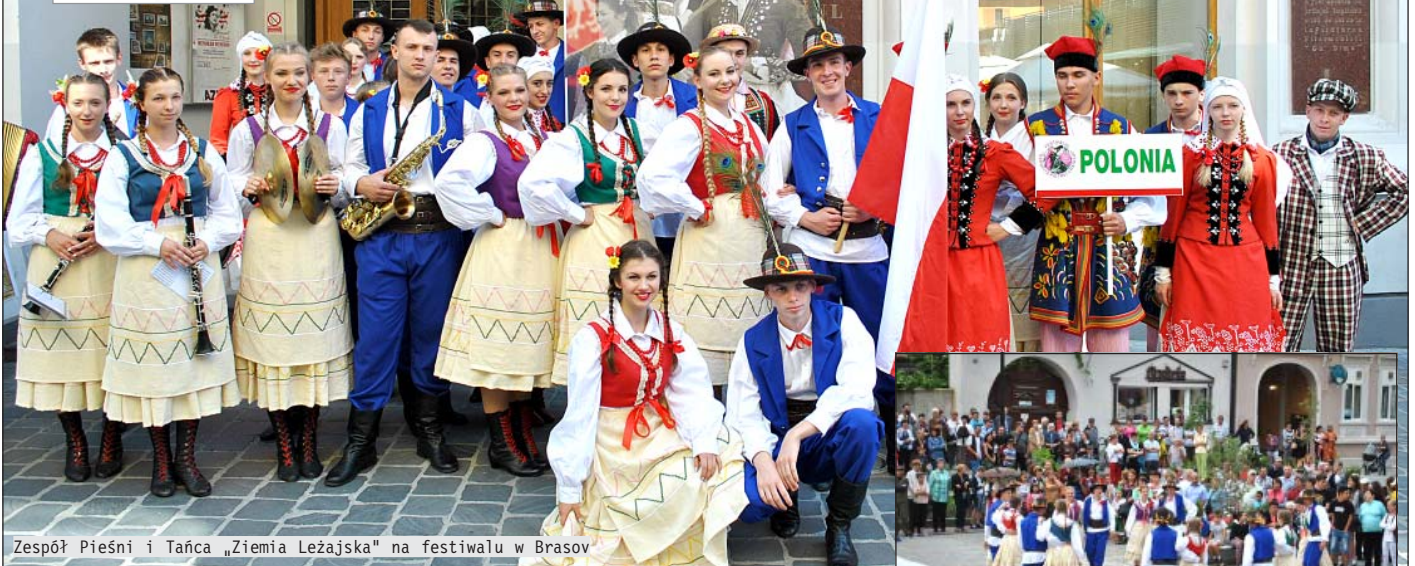
Zespół Pieśni i Tańca „Ziemia Leżajska” na festiwalu w Brasov

Działający przy Zespole Szkół Technicznych w Leżajsku Zespół Pieśni i Tańca „Ziemia Leżajska” po raz trzeci wziął udział w Międzynarodowym Festiwalu Folklorystycznym „Garofita Pietrei Craiului” w Brasov w Rumunii.