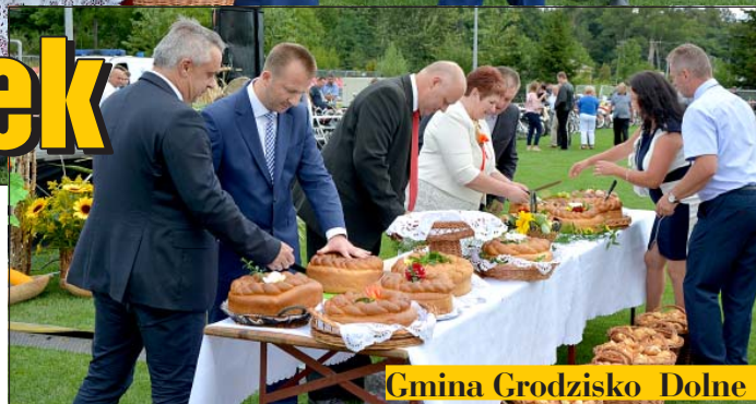
Gmina Grodzisko Dolne