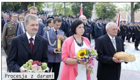
Procesja z darami