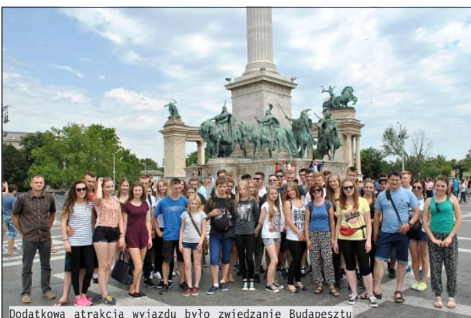
Dodatkową atrakcją wyjazdu było zwiedzanie Budapesztu

Odbywający się w lipcu festiwal, organizowany jest przez miejscowe Centrum Kulturalne Reduta, które zaprosiło zespoły ludowe z Bośni i Hercegowiny, Polski, Serbii, Grecji, Węgier oraz Rumunii. Grupy taneczne i kapela „Ziemi Leżajskiej” wzięły udział w paradzie ulicami Brasov, wystąpiły na scenie w centrum miasta, a także zaprezentowały przygotowany program artystyczny w miejscowościach Fagaras i Rasnov. Aby umi-