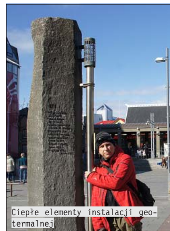
Ciepłe elementy instalacji geotermalnej

z ojca, matki i dwojga dzieci przeciwnej płci każda osoba będzie miała inne nazwisko. Książki telefoniczne układa się alfabetycznie, ale według imion. Wszyscy zwracają się do siebie po imieniu, nawet przy oficjalnych spotkaniach. 1/3 społeczeństwa uczestniczy w programie oddawania swoich genów, tworząc bazę genową Islandczyków – dla przyszłych pokoleń. Ze względu na tanią energię geotermalną Islandia to jedyne miejsce w Europie, gdzie hoduje się banany w szklarniach. Praktycznie 100% Islandczyków umie czytać i pisać, a na wyspie wydaje się najwięcej książek i gazet w przeliczeniu na mieszkańca. Złośliwi mówią, że jeśli ktoś na Islandii nie czyta książek, to na pewno... sam je pisze.