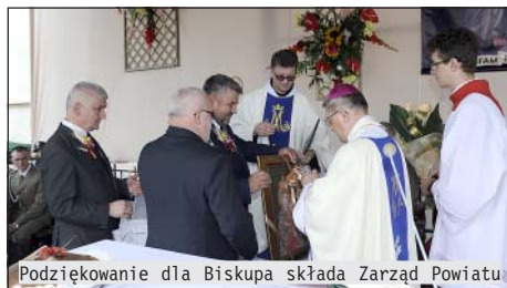
Podziękowanie dla Biskupa składa Zarząd Powiatu