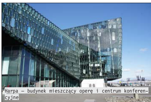
Harpa – budynek mieszczący operę i centrum konferencyjne