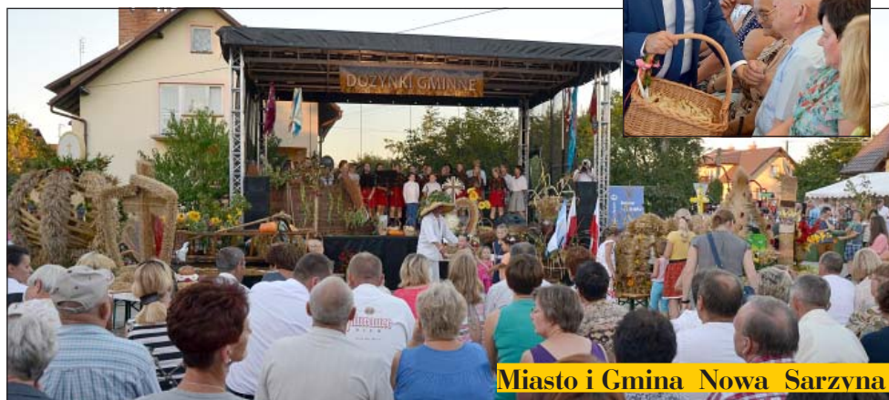
Miasto i Gmina Nowa Sarzyna