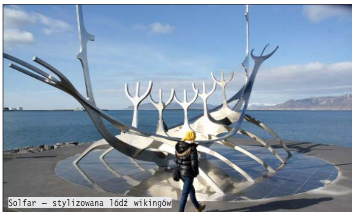
Solfar – stylizowana łódź wikingów