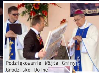
Podziękowanie Wójta Gminy Grodzisko Dolne