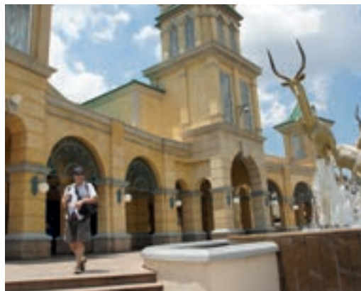
Główne wejście do kasyna w Gold Reef City

rekreacyjnej enklawy w sercu Johannesburga. Zwiedzanie miasteczka rozpoczynamy od kasyna, w którym próbujemy zagrać licząc na wielką fortunę. Niestety! Lżejsi o kilkaset rantów opuszczamy kasyno. Park swoim charakterem nawiązuje do gorączki złota, która rozpoczęła się tutaj w 1886 roku. Pracownicy parku noszą kostiumy z epoki, a budynki są zaprojektowane tak, aby naśladować ten okres. Największą atrakcją parku jest zabytkowa kopalnia złota, zamknięta w 1971 roku. Kupujemy bilety i już po chwili