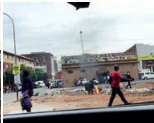
Wieczór na ulicach Johannesburga