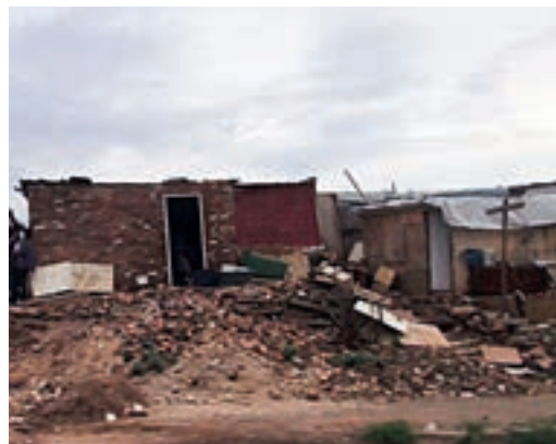
Township - slamsy okalające miasto

Historia RPA jest wyjątkowo skomplikowana, bo na tym skrawku Afryki biali ludzie, Holendrzy, pojawili się wcześniej niż przodkowie Mandeli. Nie ma tam zatem kontekstu kolonialnego. Jednak stosunki między czarną i białą ludnością od zawsze układały się nieszczerólnie. RPA było krajem, w którym doszło