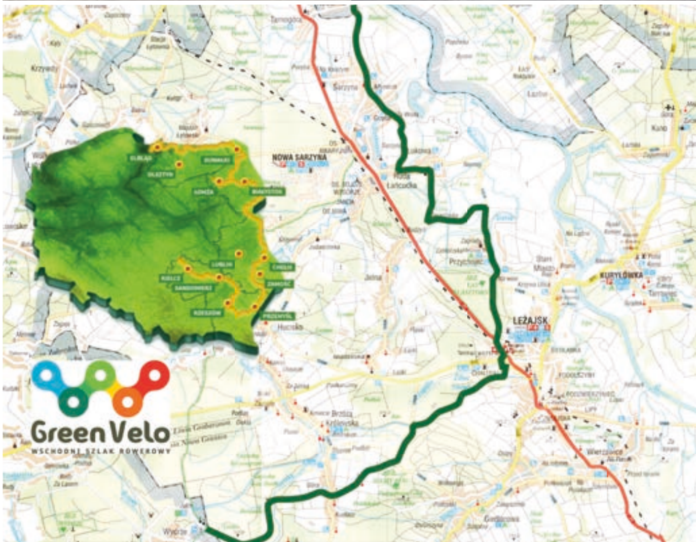
Szlak rowerowy przebiegał będzie przez 5 województw