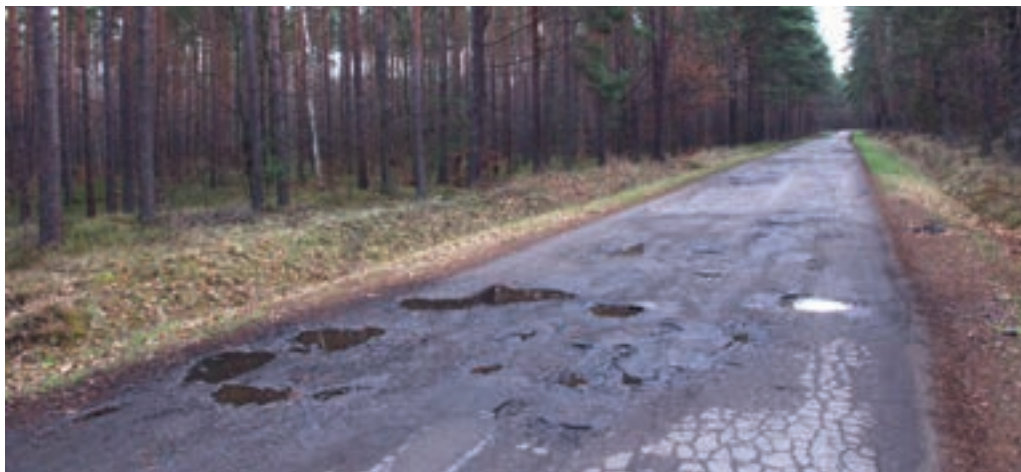
Droga Kopanie Żołyńskie - Grodzisko Dolne w trakcie i po remoncie

Inwestycja została dofinansowana z budżetu Państwa w kwocie 410 tys. zł co stanowi ok. 78% wartości całkowitej. Pozostałe środki pochodzą z budżetu Powiatu Leżajskiego i Gminy Grodzisko Dolne.