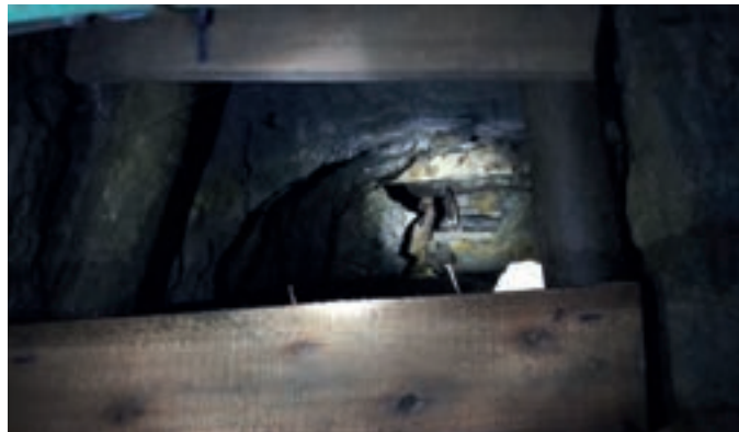
Fragment kopalnianego wyrobiska, w którym jeszcze skrzy się złoto

do separacji rasowej. Ideę nazwano apartheidem i wdrożono, jako prawo w 1948 roku. Każda z ras miała swoje urzędy, szkoły i strefy. Czarni byli wyraźnie spychani na margines społeczeństwa. Większość czarnych została pozbawiona obywatelstwa. Członkostwo w związkach zawodowych było zakazane aż do lat 80-tych. W 1960 roku po