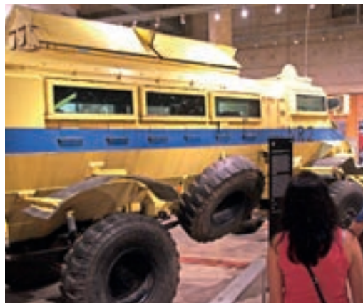
Pancerny samochód - jeden z eksponatów Muzeum Apartheidu

segregacji rasowej. Muzeum posiada dwa wejścia oznaczone jako „Biały” i „Non-biały”, w zależności od tego jaki mamy bilet, takim wejściem zostaniemy wpuszczeni.