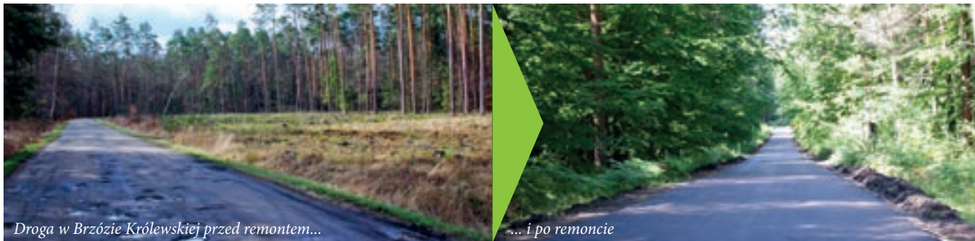
Droga w Brzozie Królewskiej przed remontem...