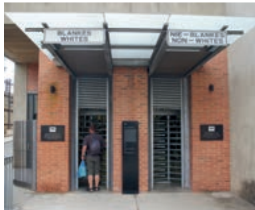
Wejście do Muzeum Apartheidu

Tekst, zdjęcia - Ireneusz Wołek www.niezwyklyswiat.com you tube niezwykly swiat RPA