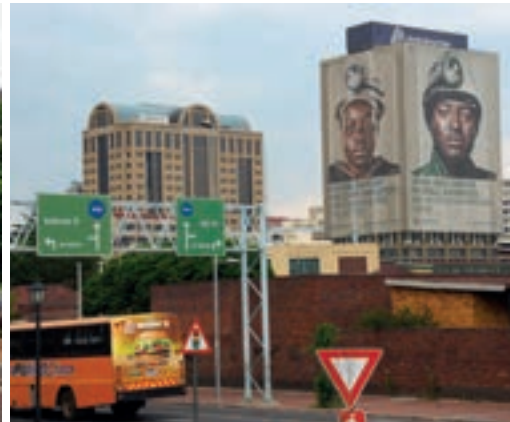
Miasto „Czarnych” górników