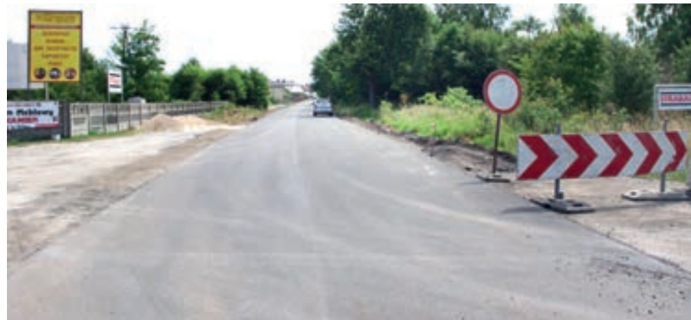
Droga Łętownia - Sarzyna w trakcie przebudowy