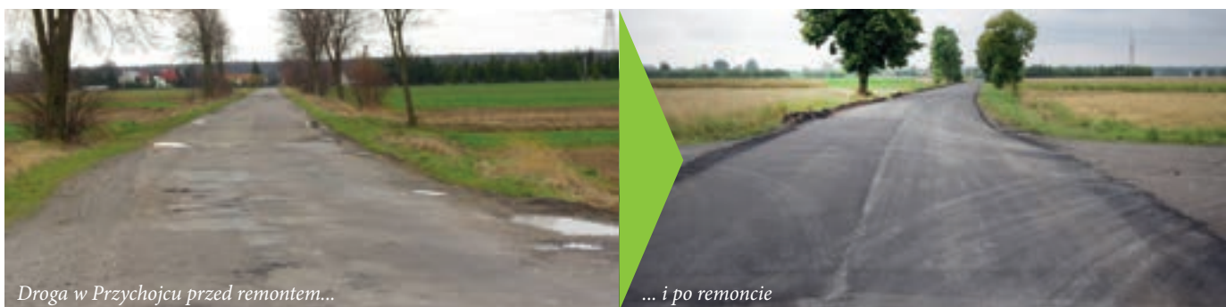
Droga w Przychojcu przed remontem...

Łączny koszt zadania w budżecie Powiatu Leżajskiego wynosi: 1 043 tys. zł z czego dofinansowanie ze środków z UE wyniesie 843,6 tys. zł, a wkład własny powiatu 199,4 tys. zł.