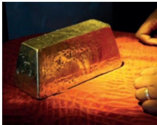
Cenne złoto, na którym wyrosło miasto