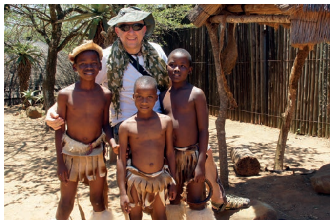
To najcenniejsza pamiątka

nej, to chyba wszystko. Po chwili następne olśnienie: góra stołowa, kopalnie złota, diamentów, parki narodowe, surferzy, Zulusi, niezłe wino, Kapsztad, Johannesburg, Przylądek Igielny i AIDS. W mojej głowie zaczął się rysować niezwykle różnorodny i fascynujący kraj. Po kilku minutach, wertuję już moją biblioteczkę w poszukiwaniu przewodnika. Okazało się, że