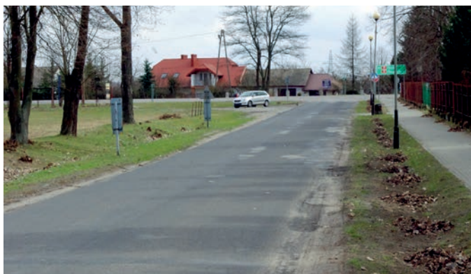
Droga powiatowa Nr 1084R