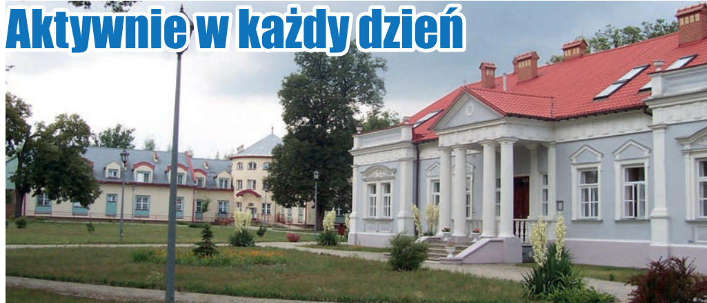
Dom Pomocy Społecznej Piskorowice – Mołynie

Codziennosc wypełniają zajęcia kulturalno-oświatowe i rekreacyjne, terapeutyczne, usprawniające i wspierające. Na stałe w dzień mieszkańców wpisały się próby wokalne, próby taneczne, małe formy teatralne, zabawy okolicznościowe w tym „urodziny”, przegląd prasy codziennej, filmoterapia.