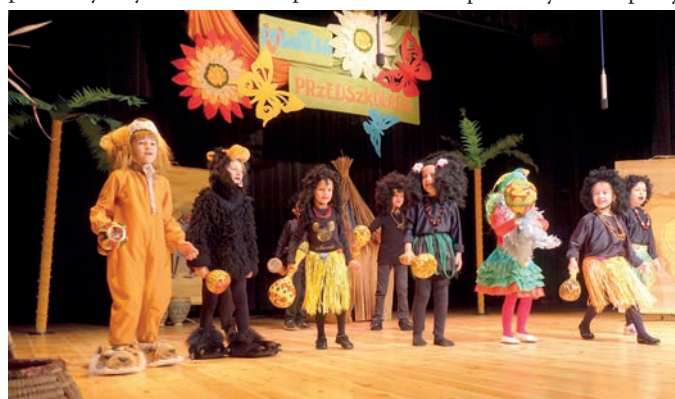
V Powiatowa Przedszkolada

Poradnia jest dobrze wyposażona w narzędzia diagnostyczne i pomoce dydaktyczne niezbędne do skutecznej pracy diagnostycznej – terapeutycznej, profilaktycznej, konsultacyjno – doradczej i informacyjnej oraz w sprzęt specjalistyczny do pracy fizjoterapeutycznej. Ostatnie zakupy inwestycyjne to: innowacyjny zestaw do diagnozy i treningu uwagi słuchowej metodą Tomatisa, wcześniej zakupiono 2 zestawy do terapii metodą EEG Biofeedback (2007 r.). Warto nadmienić, że leżajska poradnia jako pierwsza w Polsce zakupiła innowacyjny zestaw do diagnozy i treningu uwagi słuchowej metodą Tomatisa w polskiej wersji wyprodukowanej przez Young Digital Planet w kooperacji z Politechniką Gdańską (III 2013 r.). Współpraca z YDP zaowocowała udziałami pracowników poradni w charakterze prelegentów w ogólnopolskich konferencjach „Metoda Tomatisa uczy słuchać”, które odbyły się w Katowicach (24 X 2013 r.) i Toruniu (6 XI 2013 r.). Podczas tych konferencji omawiano wykorzystywanie przez poradnię w Leżajsku specjalistycznego sprzętu i programów komputerowych w pracy