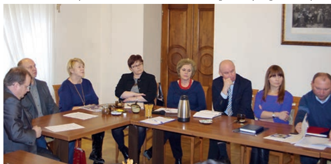
Zaproszeni goście na VI sesji Rady Powiatu Leżajskiego

Kolejna sesja poświęcona była głównie sprawozdaniem m.in. z wykonania planu finansowego SP ZOZ za rok 2014, z działalności Powiatowego Urzędu Pracy, z działalności placówek opiekuńczo - wychowawczych oraz zakresu pomocy społecznej za