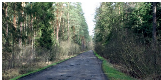
Droga powiatowa Nr 1260R