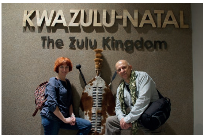
Tutaj rozpoczęła się nasza kolejna przygoda