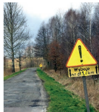
Droga powiatowa Nr 1268R