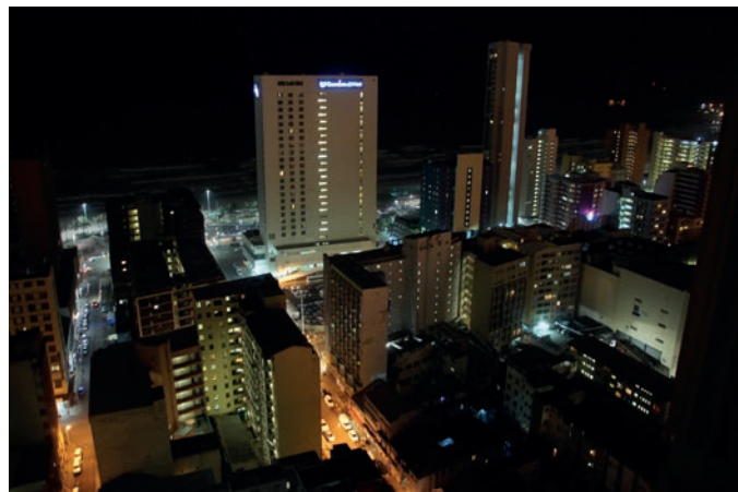
Nocna panorama Durbanu