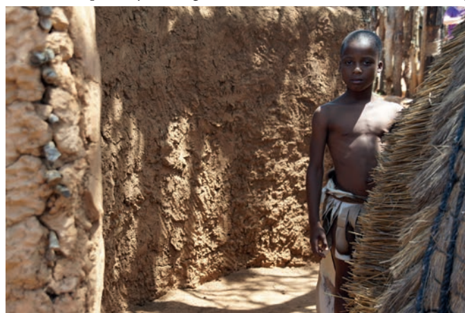
Ciekawość - działa w dwie strony