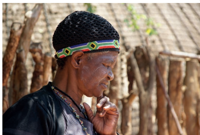
Tradycyjne ozdoby z koralików

dzinie jazdy zatrzymujemy się na jednej z plaż, targanych wielkimi falami i porywistym wiatrem. Tylko my i kilku wędkarzy.