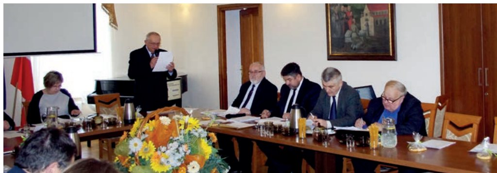
VII sesja Rady Powiatu Leżajskiego