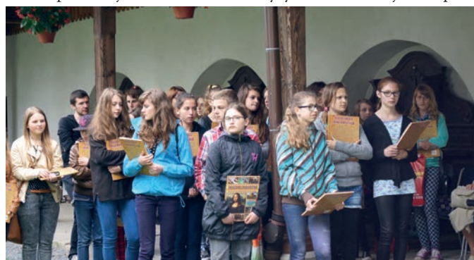
Powiatowy Profilaktyczny Konkurs Plakatowy XIII edycja

Od 2008 r. w sposób planowy zgodnie z procedurami prowadzona jest w poradni interwencja kryzysowa i mediacje. Do pracy