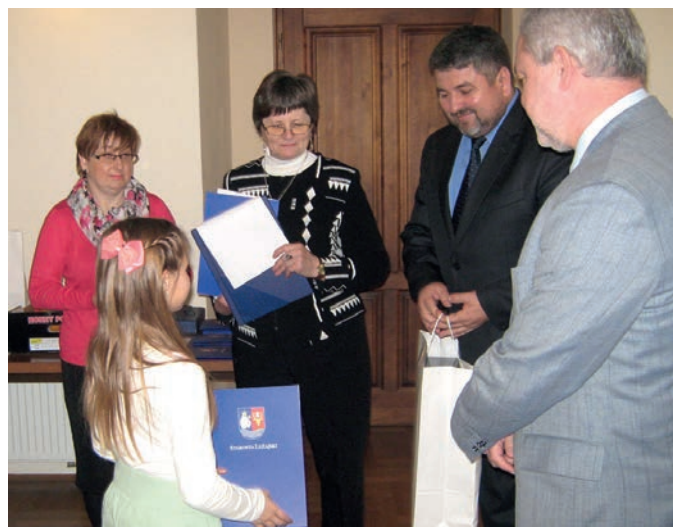
Nagrodzone prace można obejrzeć w holu PSSE w Leżajsku.