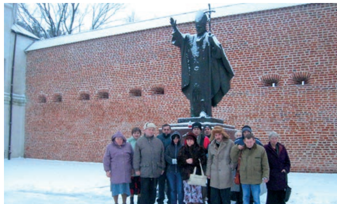
Wycieczka do Klasztoru OO. Bernardynów w Leżajsku

W ciągu roku organizowane są też inne spotkania, na które zapraszani są goście z zaprzyjanzionego Domu Pomocy w Brzozie Królewskiej: „ognisko majowe” i „Święto pieczonego ziemniaka”. Czasem ze spontaniczną wizytą przyjeżdżają dzieci z pobliskiej Szkoły Podstawowej w Piskorowicach,