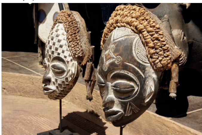
Maski z regionu Kwa Zulu-Natal