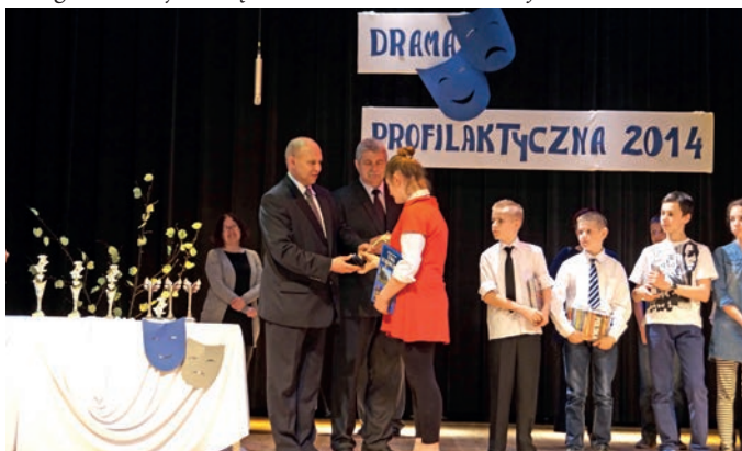
Drama profilaktyczna 2014

- „Internet – jak bezpiecznie z niego korzystać”, „Relacje koleżeńskie”, „Przestrzeganie norm społecznych”, „Profilaktyka uzależnień e-papierosy” – Zespół Szkół w Giedlarowej – 207 uczniów;