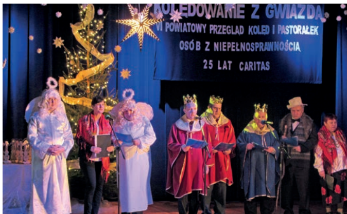
Występ wokalny na VI powiatowym przeglądzie kołed i pastorałek osób z niepełnosprawnością

funkcjonowania społecznego m.in. wyrabianie zaradności osobistej, pobudzenie aktywności społecznej oraz wyrabianie umiejętności samodzielnego wypełniania ról społecznych. W ramach treningu mieszkańcy wyjechali autobusem do Sieniawy gdzie samodzielnie zrealizowali swoje potrzeby: poczta, sklep, apteka, kawiarnia.