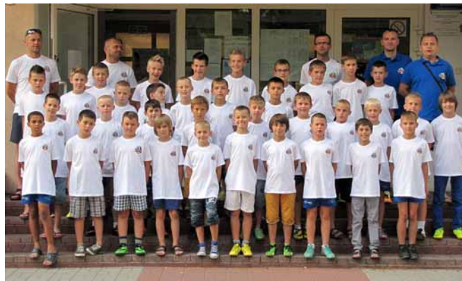
▲ Uczestnicy obozu w Zwierzyńcu