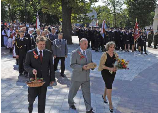
▲ Procesja z darami