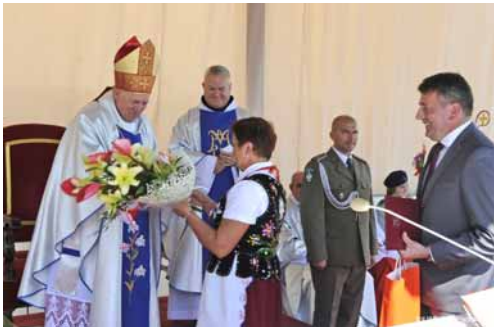
▲ Podziękowanie dla Ks. Biskupa od Gminy Leżajsk