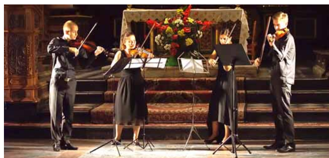
▲ Wrocławski Kwartet Smyczkowy