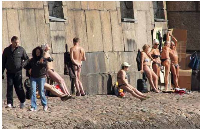
▲ Ulubiony sposób spędzania wolnego czasu przez mieszkańców Petersburga

przedsmak kolekcjonerskich skarbów. Imitacje słynnych Jajek Gustava Faberge. Pierwsze jajko powstało w 1884 na zlecenie Aleksandra III, jako prezent dla żony cesarza Marii. Po śmierci cara jego syn, Mikołaj II kontynuował tradycję zamawiania jednego jajka na Wielkanoc. W środku jajka zazwyczaj kryła się niespodzianka, która aż do momentu otwarcia podarunku była objęta ścisłą tajemnicą. W 1900 roku jajka wystawione na Wystawie Światowej w Paryżu zostały nagrodzone złotymi medalami, a jubiler otrzymał Legię Honorową i stał się sławny w całej Europie. Do wybuchu rewolucji powstały 54 jajka carskie. Niestety czas rewolucji zmusił jubilera do ucieczki z kraju. Dzisiaj carskie jajka to jubilerski św. Graal. Ceny za ośmiocentymetrowe cacko to kilkanaście milionów dolarów. Kolejne pomieszczenie to rosyjskie nalewki i wódki, które można degustować w sklepie. Z nadbrzeża już tylko jeden krok dzieli nas od Placu Pałacowego. Mieszkańcy mówią o nim, że jest „najpiękniejszym miejscem na świecie”. To chyba zbyt optymistyczne określenie, ale plac robi na każdym duże wrażenie. Przez lata plac był świadkiem wielu zawirowań. W 1843 roku stawiając kolumnę Aleksandra świętowano tu zwycięstwo