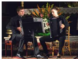
▲ Duo Accosphere