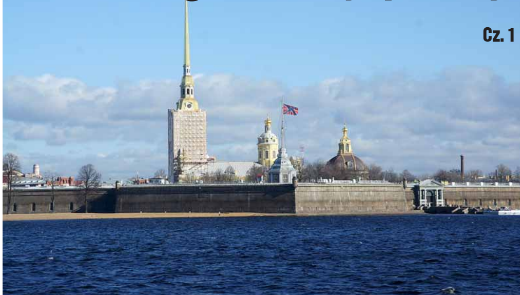
▲ Widok na Twierdzę Pietropawłowską

Romanowów i oddając komunistom władzę, zmieniła losy całej Europy. Sygnał do rozpoczęcia rewolucji padł z krążownika Aurora, zacumowanego obecnie przy nadbrzeżu Pietrogrodzkim. Zza licznych straganów z pamiątkami, robimy kilka zdjęć szaro-niebieskiego krążownika i idziemy w stronę najstarszej części Petersburga jaką jest Wyspa Zajęcza. Tutaj znajduje się pierwsza budowla wzniesiona z rozkazu cara – Twierdza Pietropawłowska. Historia twierdzy jest dość ponura. Przy jej budowie zginęło wielu robotników, a później w jej murach przetrzymywano więźniów politycznych. Najpiękniejszym obiektem w obrębie murów jest sobór świętych Piotra i Pawła, który w niczym nie przypomina tradycyjnych rosyjskich soborów przykrytych kopułami. Dzięki pozłacanej, strzelistej iglicy, do lat 60-tych XX wieku był on najwyższą budowlą miasta. Iglice wieńczy rzeźba anioła, którą widać z wielu odległych miejsc Pe-