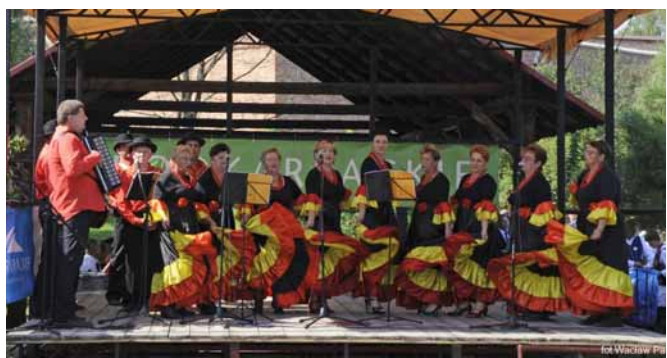
▲ Występ Zespołu Brzozoki