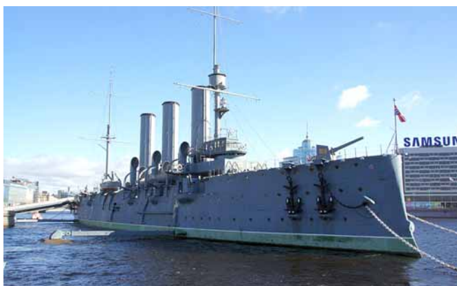
▲ Symbol Rewolucji Październikowej – krążownik Aurora

nałożono tutaj ekskomunię na Lwa Tołstoję, który w dziele „Zmartwychwstanie” otwarcie krytykował prawosławie. Od śmierci Piotra I Wielkiego sobór stał się miejscem wiecznego spoczynku władców Rosji. W 1998 r. z wielką pompą złożono tutaj szczątki ostatniego z Romanowów Mikołaja II i jego najbliższych, rozstrzelanych przez bolszewików w 1918 roku. Przez bramę Neską wychodzimy z twierdzy w stronę Newy. Tutaj oprócz wspaniałego widoku na prawobrzeżny Petersburg naszą uwagę przyciąga ciekawy sposób spędzania wolnego czasu przez mieszkańców. Nawet dzisiaj, kiedy jest około 10 stopni C, pod murami zebrała się spora grupka miłośników opalenizny. Potrzeba czy poza – trudno zgadnąć! Opuszczając twierdzę przechodzimy obok posągu cara Piotra, który od lat jest przedmiotem licznych dyskusji. Pomimo nieproporcjonalnie małej głowy w stosunku do reszty ciała ma w sobie coś sympatycznego. Na nadbrzeżu odwiedzamy okazały sklep z pamiątkami. Na półkach obok dzwonek i pozytywek dominują tradycyjne drewniane matryoszki wkładane jedna w drugą. W następnym pomieszczeniu