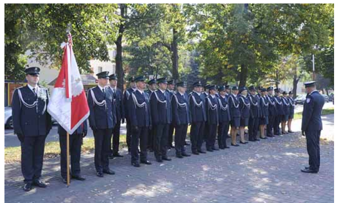
▲ Kompania honorowa Służby Celnej