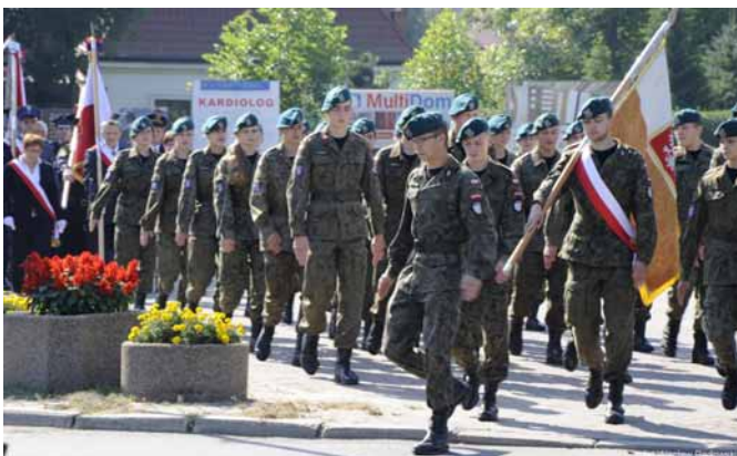
▲ Kompania Honorowa Jednostki Strzeleckiej 2035 z Leżajska