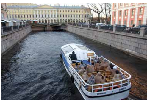
▲ Koce, to standardowe wyposażenie stateczków pływających po kanałach.

Tekst, zdjęcia Ireneusz Wołek www.niezwykly-swiat.com You Tube Niezwykly Swiat – Rosja 27