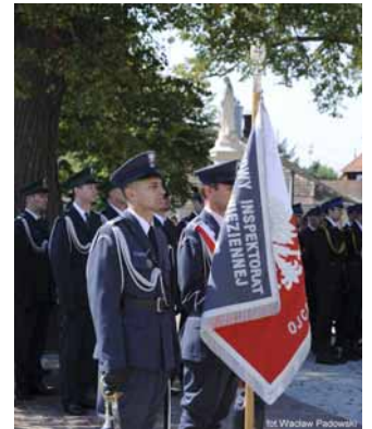
▲ Delegacja służby więziennej

Do leżajskiego sanktuarium przybyli dowódcy służb mundurowych z Podkarpacia wraz z lic-