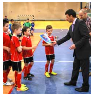
▲ Leżajsk Cup

W dniach 2-6.08.2014 r. odbył się obóz sportowy dla 35 zawodników w Zwierzyńcu. Dzieci oprócz regularnych treningów rozegrały po dwa mecze sparingowe z drużynami Hetman Zamość. Dodatkowo miały zapewnione szereg