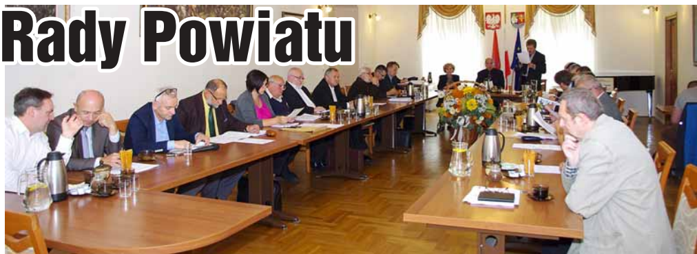
▲ Sesja Rady Powiatu Leżajskiego

Zaplanowanych w br. 582 tys. zł przychodów, na koniec pierwszego półroczia Muzeum Ziemi Leżajskiej zrealizowało 292 tys. zł, zaś po stronie kosztów, odpowiednio 772 tys. zł i 383 tys. zł. Rada Powiatu przyjęła informacje SP ZOZ