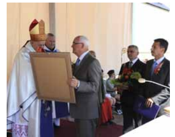
▲ Podziękowanie dla Ks. Biskupa od Zarządu Powiatu Leżajskiego