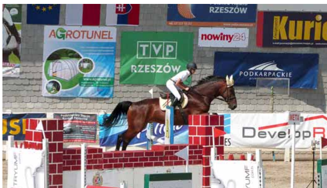
▲ Skoki konne przez przeszkody