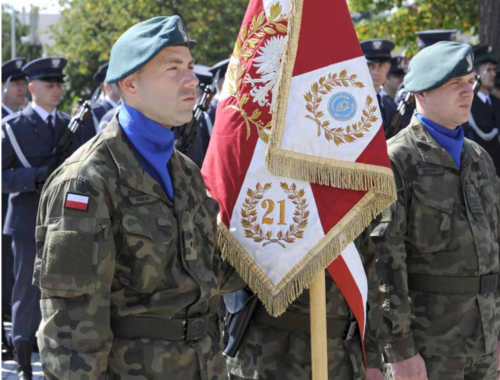
▲ Kompania honorowa Wojska Polskiego

W święto Narodzenia Najświętszej Maryi Panny, do Bazyliki OO. Bernardynów w Leżajsku przybyły pododdziały służb mundurowych Województwa Podkarpackiego oraz delegacje z wieńcami dożynkowymi z gmin z terenu powiatu. W tym roku do Klasztoru przybyło 22 delegacje wieńcowe oraz 6 kompanii honorowych wraz z pocztami sztandarowymi.