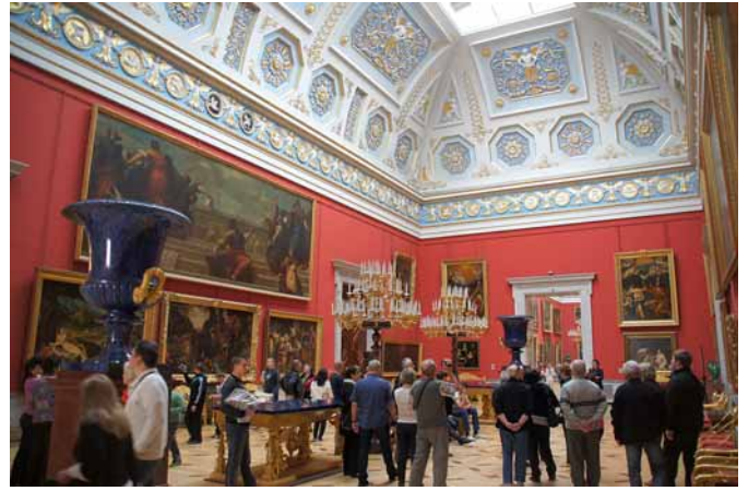
▲ Jedna z sal Ermitażu

przedsmak kolekcjonerskich skarbów. Imitacje słynnych Jajek Gustava Faberge. Pierwsze jajko powstało w 1884 na zlecenie Aleksandra III, jako prezent dla żony cesarza Marii. Po śmierci cara jego syn, Mikołaj II kontynuował tradycję zamawiania jednego jajka na Wielkanoc. W środku jajka zazwyczaj kryła się niespodzianka, która aż do momentu otwarcia podarunku była objęta ścisłą tajemnicą. W 1900 roku jajka wystawione na Wystawie Światowej w Paryżu zostały nagrodzone złotymi medalami, a jubiler otrzymał Legię Honorową i stał się sławny w całej Europie. Do wybuchu rewolucji powstały 54 jajka carskie. Niestety czas rewolucji zmusił jubilera do ucieczki z kraju. Dzisiaj carskie jajka to jubilerski św. Graal. Ceny za ośmiocentymetrowe cacko to kilkanaście milionów dolarów. Kolejne pomieszczenie to rosyjskie nalewki i wódki, które można degustować w sklepie. Z nadbrzeża już tylko jeden krok dzieli nas od Placu Pałacowego. Mieszkańcy mówią o nim, że jest „najpiękniejszym miejscem na świecie”. To chyba zbyt optymistyczne określenie, ale plac robi na każdym duże wrażenie. Przez lata plac był świadkiem wielu zawirowań. W 1843 roku stawiając kolumnę Aleksandra świętowano tu zwycięstwo