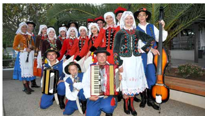
▲ Zespół Pieśni i Tańca „Ziemia Leżajska” na festiwalu w Grecji

Działający przy Zespole Szkół Technicznych w Leżajsku Zespół Pieśni i Tańca „Ziemia Leżajska” wziął udział w III Międzynarodowym Festiwalu „Kasandra – Halkidiki – Agios Mamas” w Grecji. Trwający od 30 sierpnia do 5 września festiwal jest organizowany pod auspicjami UNESCO przez lokalne władze i stowarzyszenia kulturalne.