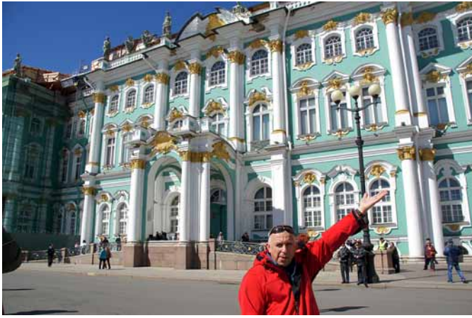
▲ Pałac Zimowy – mieszczący jedno z największych muzeów świata – Ermitaż