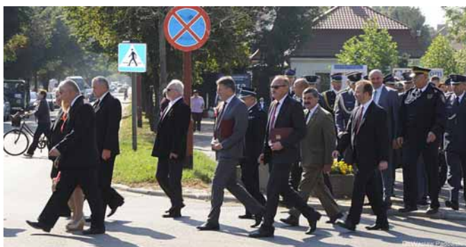
▲ Uroczysty przemarsz