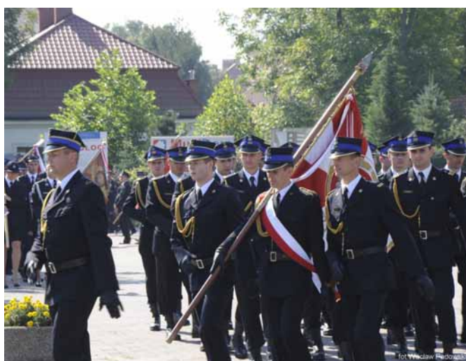
▲ Kompania honorowa Państwowej Straży Pożarnej