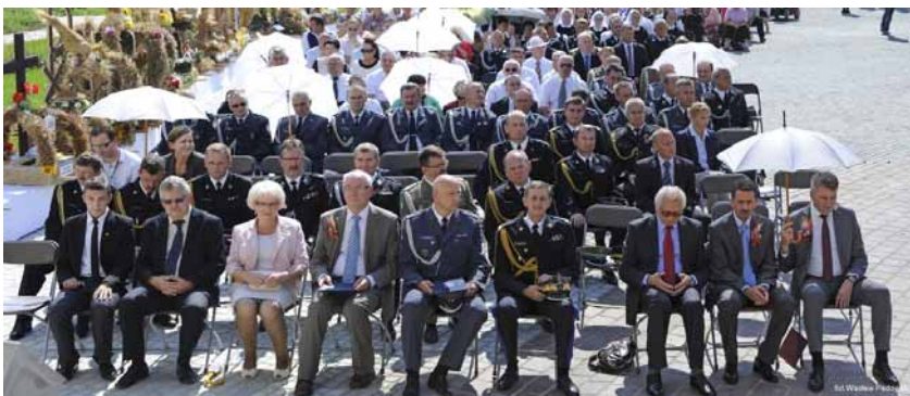
▲ Organizatorzy oraz zaproszeni goście