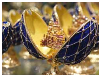
▲ Jajka Faberge w wersji dla turystów

Romanowów i oddając komunistom władzę, zmieniła losy całej Europy. Sygnał do rozpoczęcia rewolucji padł z krążownika Aurora, zacumowanego obecnie przy nadbrzeżu Pietrogrodzkim. Zza licznych straganów z pamiątkami, robimy kilka zdjęć szaro-niebieskiego krążownika i idziemy w stronę najstarszej części Petersburga jaką jest Wyspa Zajęcza. Tutaj znajduje się pierwsza budowla wzniesiona z rozkazu cara – Twierdza Pietropawłowska. Historia twierdzy jest dość ponura. Przy jej budowie zginęło wielu robotników, a później w jej murach przetrzymywano więźniów politycznych. Najpiękniejszym obiektem w obrębie murów jest sobór świętych Piotra i Pawła, który w niczym nie przypomina tradycyjnych rosyjskich soborów przykrytych kopułami. Dzięki pozłacanej, strzelistej iglicy, do lat 60-tych XX wieku był on najwyższą budowlą miasta. Iglice wieńczy rzeźba anioła, którą widać z wielu odległych miejsc Pe-