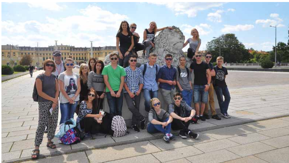
▲ Dodatkową atrakcją wyjazdu było zwiedzanie Wiednia