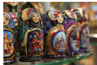
▲ Matryoszki – to najpopularniejsza rosyjska pamiątka