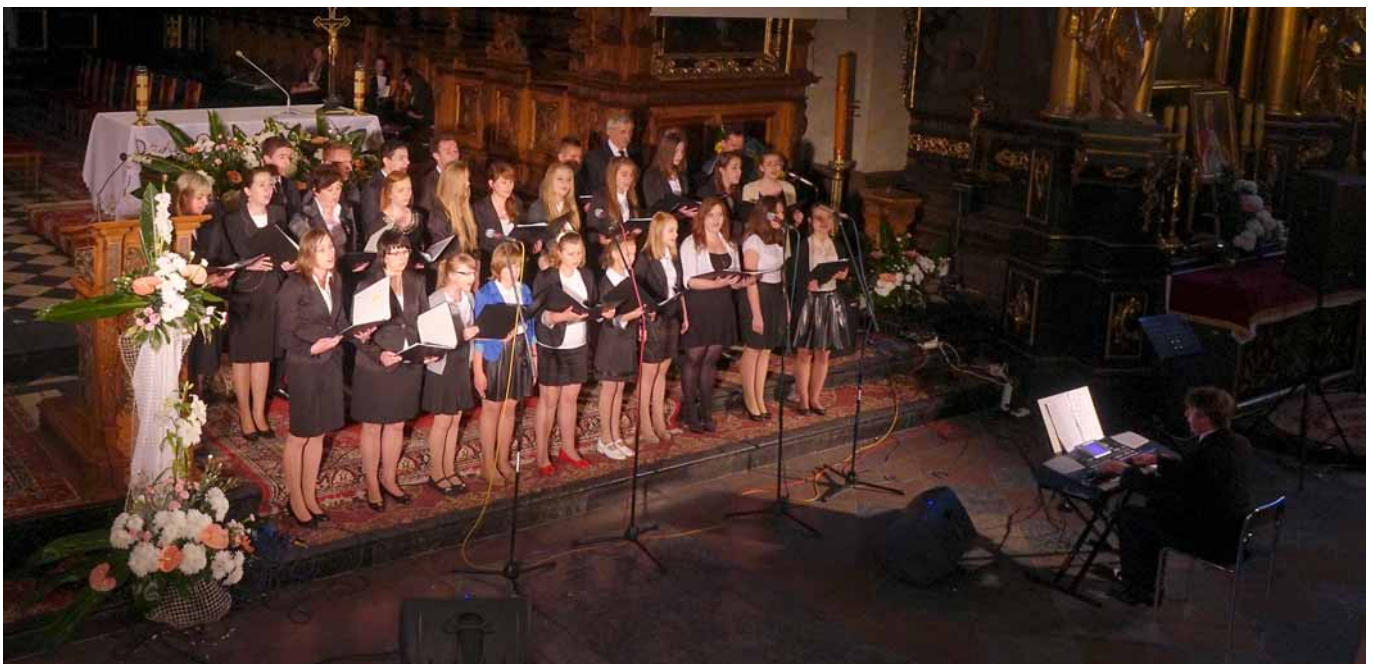
▲ Chór „Veritas” działający przy Zespole Szkół w Nowosielcach.