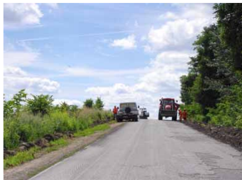
▼ ▲ Przebudowa drogi na odcinku Grodzisko – Giedlarowa.