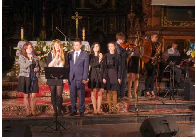
▲ Zespół wokalnoinstrumentalny Labirynt z Zespołu Szkół Licealnych w Leżajsku.

Repertuar Przeegładu jest z roku na rok coraz bogatszy, zaskakuje nas różnorodnością form, ciekawymi aranżacjami oraz profesjo-