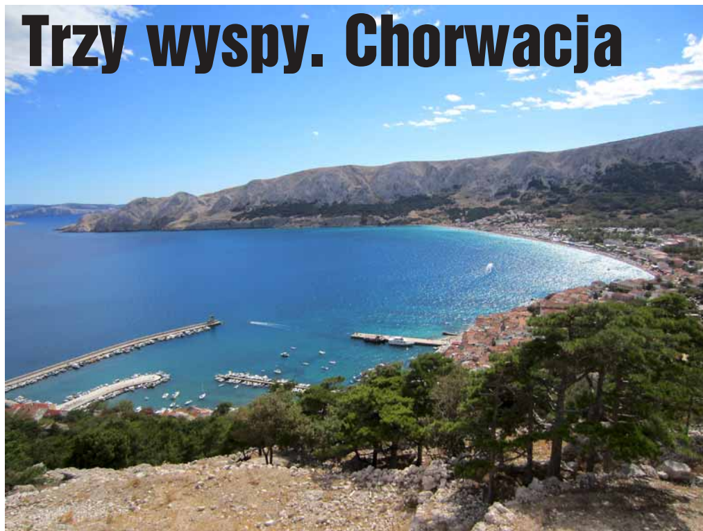
▲ Miasteczko Baska z najdłuższą piaszczystą plażą Chorwacji.

Po dwóch godzinach jazdy jesteśmy na przejściu granicznym w Barwinku. Kawa, herbata, wymiana złotych na chorwackie kuny, tankowanie i ruszamy dalej. Na Słowacji mocno zwalniamy. Tutejsza Policja jest bezwzględna. Kilka kilometrów szybciej i 50 euro w kieszeni mniej. Słońce świeci coraz mocniej. W upale dojeżdżamy do Węgierskiej stolicy. Zatrzymujemy się na Dunajem dzielącym miasto na dwie części. Prawobrzeżną pagórkowata Budę i lewobrzeżną, nizinny Peszt z dominującą sylwetką parlamentu. Po dłuższym odpoczynku, ruszamy dalej. Pokonując kolejne skrzyżowania w morderczym upale, boleśnie przekonujemy się jak wielkie jest to miasto. Za miastem odyskujemy siły. Na autostradzie ki-