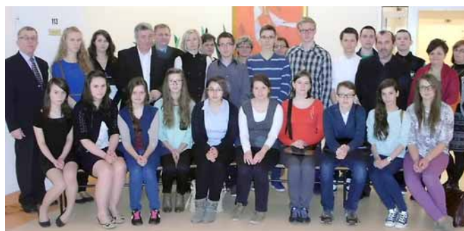
▲ Finaliści i opiekunowie Międzypowiatowego Konkursu Historycznego.

Celem konkursu było: wyłanianie talentów i wspieranie uczniów zdolnych w rozwijaniu i poszerzaniu zainteresowań historycznych, motywowanie uczniów do samodzielnego poszerzania wiedzy historycznej, pomoc uczniom