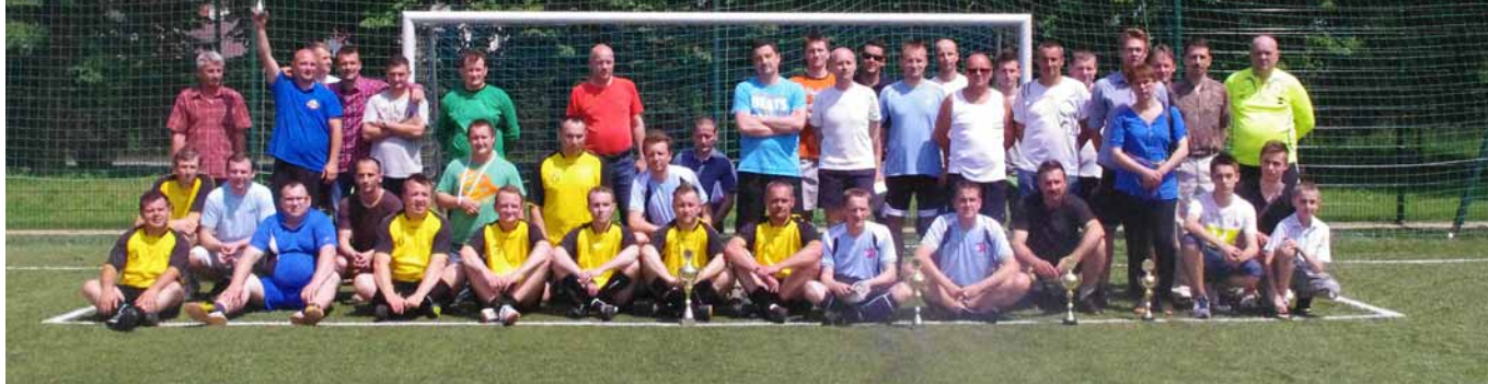
▲ Uczestnicy turnieju.

W dniu 7 czerwca 2014 roku na boisku Orlik przy Zespole Szkół Licealnych w Leżajsku odbył się turniej piłki nożnej poświęcony śp. Ryszardowi Ostrowskiemu.