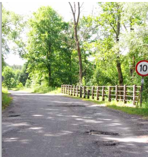
▲ Przebudowa drogi na odcinku Brzyska Wola – Dąbrowica.