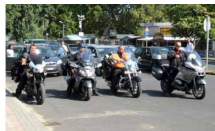
▲ Ruszamy na prom.

Po południu, bez zbędnego bagażu ruszamy na południe wyspy, zwanej również „Złotą wyspą”, gdyż jej piaszczyste plaże, zacho-