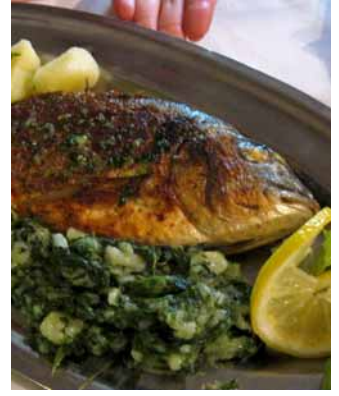
▲ Wyśmienita dorada.