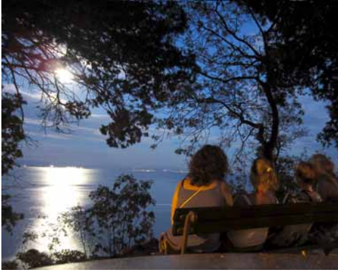
▲ Wieczór na promenadzie w Opatiji.