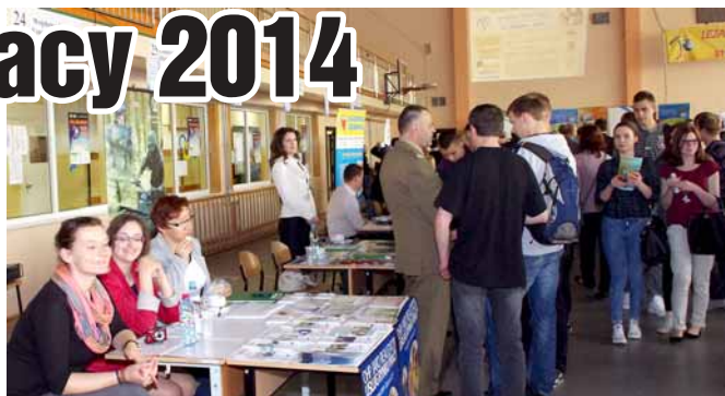
▲ Stoiska wystawiennicze w ZST w Leżajsku.

większość uczestnicy bardzo pozytywnie ocenili takie przedsięwzięcie ze względu na ilość przedstawionych ofert, ich różnorodność i atrakcyjność. Najczęstszymi powodami odwiedzenia targów pracy była potrze-