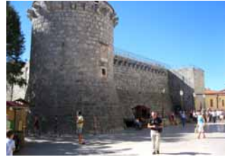
▲ Krk – imponujące fortyfikacje miasta.

wielkich hoteli i turystycznych autobusów.