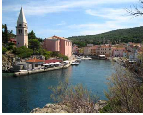
▲ Veli Lošinj.