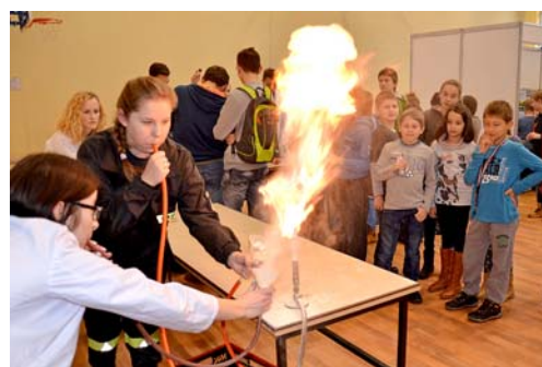
▲ Stoiska klas biologiczno-chemicznych Zespołu Szkół Licealnych w Leżajsku