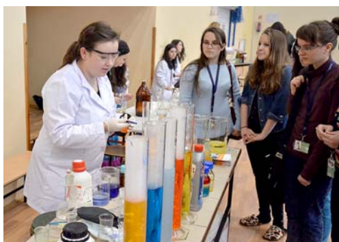
▲ Doświadczenia chemiczne prowadzone przez studentów Wydziału Chemii Politechniki Rzeszowskiej