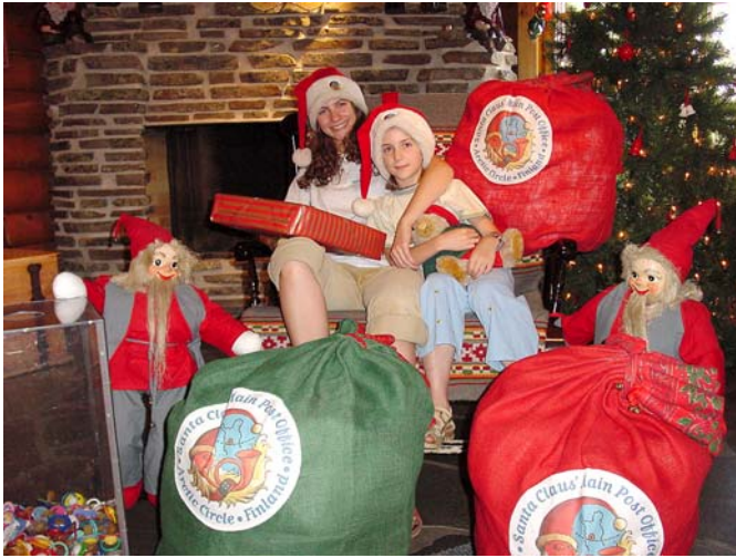
▲ Pamiątkowe zdjęcie na hotelu Św. Mikołaja