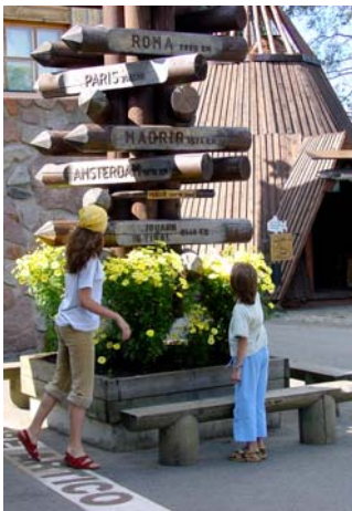
▲ Symboliczny drogowskaz