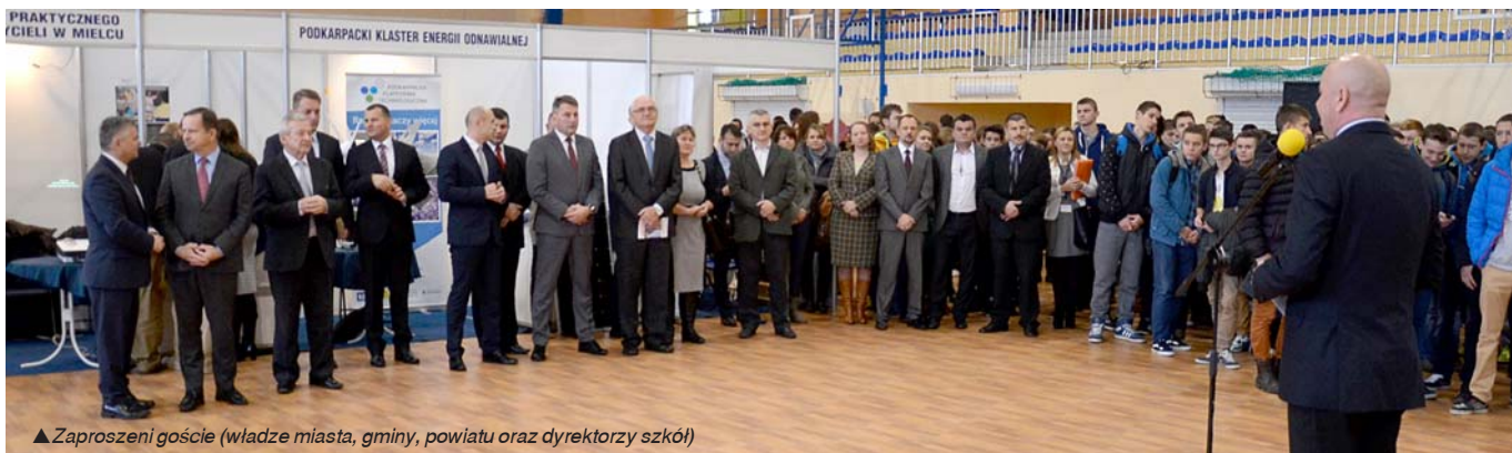
▲ Zaproszeni goście (władze miasta, gminy, powiatu oraz dyrektorzy szkół)