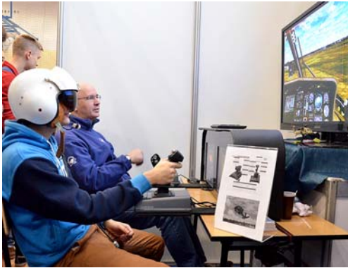
▲ Lot symulatorem śmigłowca Black Hawk – Mielecki Portal Lotniczy EPML Spotters