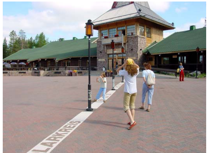
▲ Wioska Św. Mikołaja i linia wyznaczająca przebieg koła podbiegunowego