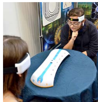
▲ Potęga Umysłu – urządzenia wykorzystujące fale mózgowo EEG do treningu koncentracji przygotowane przez Planetarium.com Piotra Solkiewicza

S.A inspirowała przybyłych pojazdami elektrycznymi. Uczniowie Zespołu Szkół im. Franciszka Lejki z Grodziska Górnego imponowa-