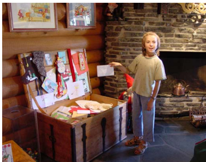
▲ Tutaj dzieci pozostawiają swoje marzenia

lonka, żona króla Szwecji Jana III Wazy. Po przejechaniu kilkuset kilometrów natrafiamy na kemping. Wynajmujemy domek, do którego w strugach deszczu przetrzucamy nasz bagaż. Dopiero po chwili zauważamy, że jest już po 23-ciej. To pierwszy nocleg, na którym witają nas białe noce. Niesamowite zjawisko, z którym nasze organizmy próbują walczyć. Zegarki mówią – trzeba iść spać – organizm – przecież jest jasno. Deszcz przestaje padać, więc wybieramy się na krótki spacer. Po godzinie wracamy do domku. Kolacja, rozmowy, planowania jutrzejszego dnia, a sen nie nadchodzi. Zaslaniajmy szczelnie okna – czas spać. Wczesnym rankiem ruszamy dalej na północ, nieustannie zbliżając się do koła podbiegunowego. Mijamy przepiękne, krystalicznie czyste jeziora, z których wyrastają