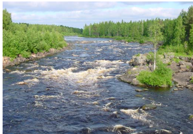
▲ Krajobraz Finlandii to lasy, olbrzymie zielone bagna, łąki oraz tysiące jezior i rzek

wym i stemplem potwierdzającym wyjątkowe miejsce wysłania przesyłki. To naprawdę niezwykle miejsce. Klientów obsługują prawdziwe elfy, trafił się i renifer czerwono-nosy. W kolejnym pomieszczeniu, tuż przy kominku znajduje się biurko i fotel, na którym siedzi sam Święty Mikołaj. Niestety mamy pecha – ponoć odpoczywa strudzony pisaniem listów. Na podłodze stoją skrzynki ze świeżą korespondencją, posegregowane według kraju. Jest i Polska.