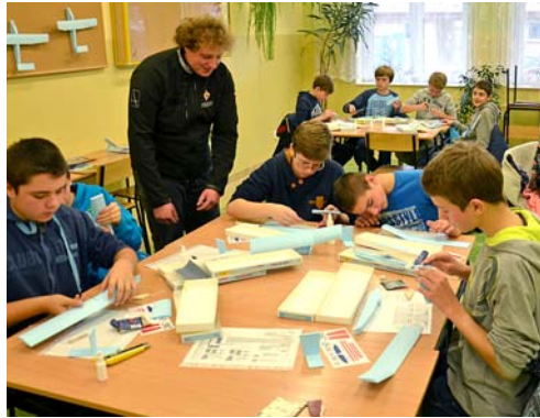
▲ Warsztaty modelarskie z budowy szybowców prowadzone przez Aeroklub Mielecki im. Braci Działowskich