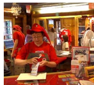
▲ Pocztowy elf

potężne góry. Na nich kolorowe, małe domki. Droga zaczyna skręcać na wschód, to znak że jesteśmy na północy Morza Bałtyckiego. Po trzech dniach podróży dotarliśmy do granicy Szwedzko-Fińskiej. Jeszcze kilkadziesiąt kilometrów i wjeżdżamy do Rovaniemi. To jedno z najsłynniejszych miast Finlandii. Znane z dwóch powodów. Tutaj przebiega umowna linia kręgu polarnego, albo inaczej koła podbiegunowego północnego. Miejsce to niemal dokładnie wyznacza granicę występowania dnia polarnego i nocy polarnej, podczas których słońce nie zachodzi lub nie wschodzi przez co najmniej 24 godziny. Tutaj również znajduje się park i wioska św. Mikołaja. Wielkim zaskoczeniem była dla nas pogoda, jakże odmienna od naszych wyobrażeń. A tu 20 stopni ciepła!