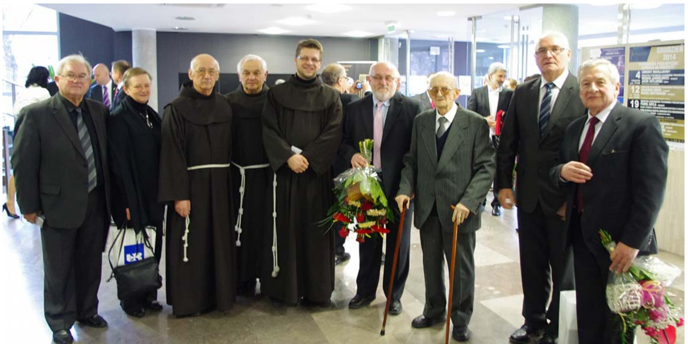
▲ Wspólne zdjęcie z laureatem

zawodowo i społecznie. Sporządził opis bibliograficzny niemal całego księgozbioru klasztoru OO. Bernardynów w Leżajsku. Oprowadza zorganizowane grupy po bibliotece zakonnej. Swoją wiedzą wspomaga studentów i osoby zainteresowane historią regionalną. Współpracuje z Muzeum Ziemi Leżajskiej. Od lat dzieli się swoimi wspomnieniami w ramach lekcji szkolnych. Jest autorem licznych publikacji dotyczących historii regionu. Odznaczony Krzyżem Partyzanckim, Krzyżem AK, Krzyżem Harcerskim, Odznaką Pamiętkową „Akcja Burza” i Odznaką Strzelecką.