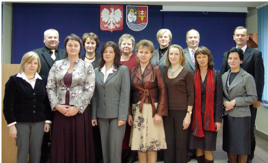
Wyróżnieni nauczyciele z Starostą Leżajskim

Przy ocenie kandydatów brano pod uwagę nauczycieli mianowanych i dyplomowanych, którzy: pracują w wymiarze co najmniej ½ etatu, posiadają co najmniej 5-letni staż pracy pedagogicznej, posiadają wyróżniającą ocenę pracy, dokonaną w okresie ostatnich 4 lat, wykazują szczególną aktywność i znaczące wyniki w zakresie: a) pracy dydaktycznej, b) pracy wychowawczej, c) pracy opiekuńczej, d) innych zadań statutowych szkoły w tym także podnoszenia kwalifikacji zawodowych i doskonalenia własnego warsztatu pracy, e) organizacji pracy.