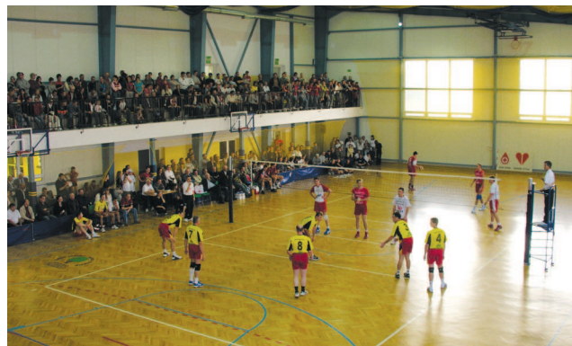
Mecz HDK z Resovią.