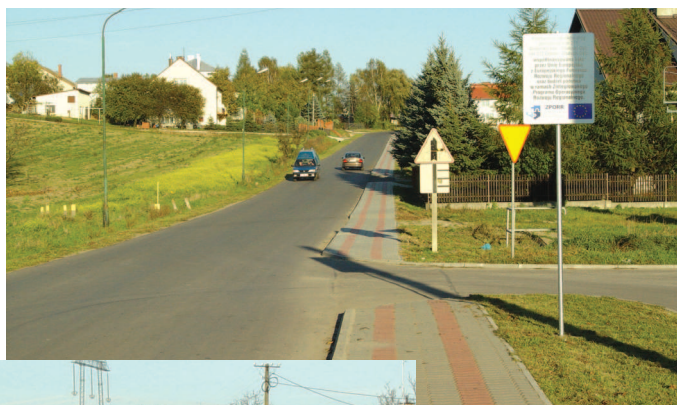
Droga Grodzisko Dłone – Chałupki Dębnińskie

Całkowita wartość projektu zamknęła się kwotą 1 675 591,61 PLN. Wartość dofinansowania z Europejskiego Funduszu Rozwoju Regionalnego wyniosła 50% wydatków kwalifikowalnych - 812 378,41 PLN. Dotacja ze środków budżetu państwa – 10% wydatków kwalifikowalnych – 162 475,68 PLN Wkład własny Powiatu Leżajskiego wyniósł 40% wydatków kwalifikowalnych 649 902,74 PLN + 50 834,78 PLN wydatków niekwalifikowalnych. Łączna długość przebudowanych dróg powiatowych to 5,783 km, w tym dwa odcinki drogi nr 271 Grodzisko Dłone – Chałupki Dębnińskie w km 0+000 – 1+340 i 3+450 – 5+578 oraz odcinek drogi nr 272 Dębno – Chałupki Dębnińskie w km 0+000 – 2+315.