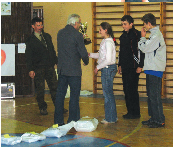
Drużyna z Grodziska Górnego odbiera zwycięski puchar

Bezapelacyjnie zwycięzcami tegorocznej edycji Ekologicznego Biegu Patrolowego zostali uczniowie Gimnazjum z Grodziska Górnego i to właśnie oni zostali szczęśliwymi posiadaczami pucharu wójta Gminy Leżajsk. Drugie miejsce zajęli gimnazjaliści z Brzozy Królewskiej, zaś trzecie klasa III Gimnazjum w Piskorowicach.