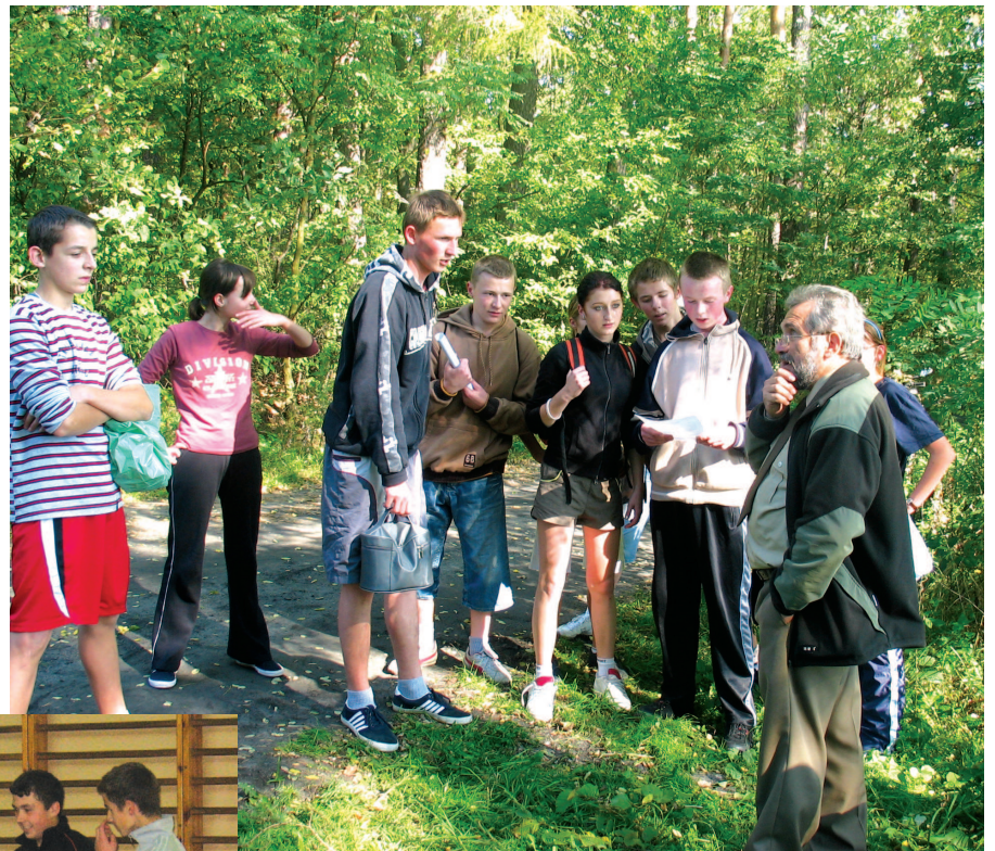
Gimnazjaliści z Wierzawic udzielają odpowiedzi na pytania leśników

Trasa biegu prowadziła wzdłuż lasu w Piskorowicach – Motyniach. Obecni na niej leśnicy zadawali pytania związane ze znajomością lokalnej roślinności, natomiast medycy przepytawali z zasad udzielania pierwszej pomocy.