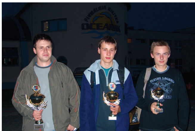
Zwycięzcy głównej konkurencji

piękną nagrodą. Między pozostałych uczestników rajdu zostało rozlosowanych wiele nagród rzeczowych, które organizatorzy zgromadzili dzięki hojności sponsorów.