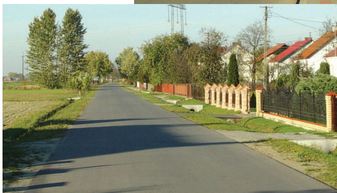
Droga Dębno – Chałupki Dębnińskie