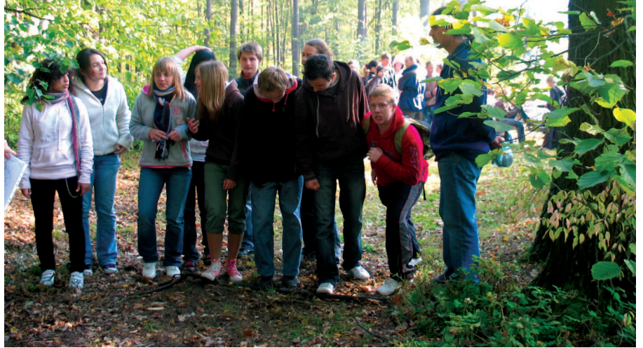
Pierwszy patrol gotowy do startu

Dwanaście patroli z 9 gimnazjów z terenu powiatu leżajskiego wzięło udział w tegorocznej VIII już edycji Ekologicznego Biegu Patrolowego. Impreza ta została zorganizowana przez Zespół Szkół w Piskorowicach, który od niedawna nosi miano Szkoły Jagiellońskiej.