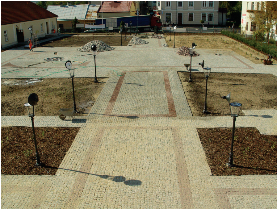
Rewaloryzacja zespołu Dworu Starościńskiego – stan prac październik 2007 r.