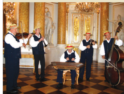
Owacyjnie przyjęty koncert Kapeli w Zamku Królewskim.

Specjalnie na tą okoliczność przygotowano prezentację, przedstawiającą