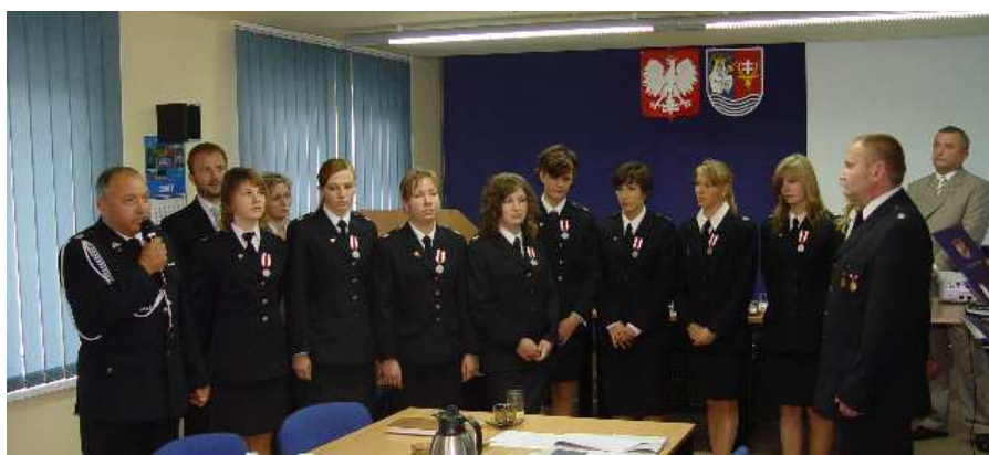
Grodziskie "złotka" podczas sesji Rady Powiatu