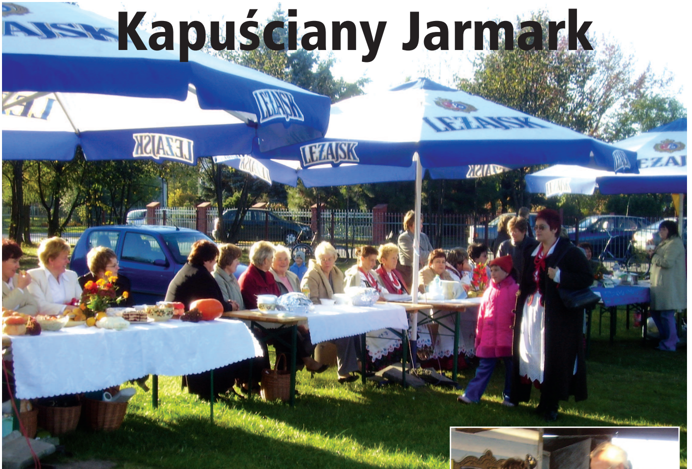
Stoiska z kapuścianymi przysmakami

Zgodnie z tradycją 14 października br. w Ośrodku Kultury w Wierzawicach została zorganizowana impreza kulturalna pod nazwą „Kapuściany Jarmark”. Wzięło w niej udział 9 Kół Gospodyń Wiejskich z terenu Gminy Leżajsk.