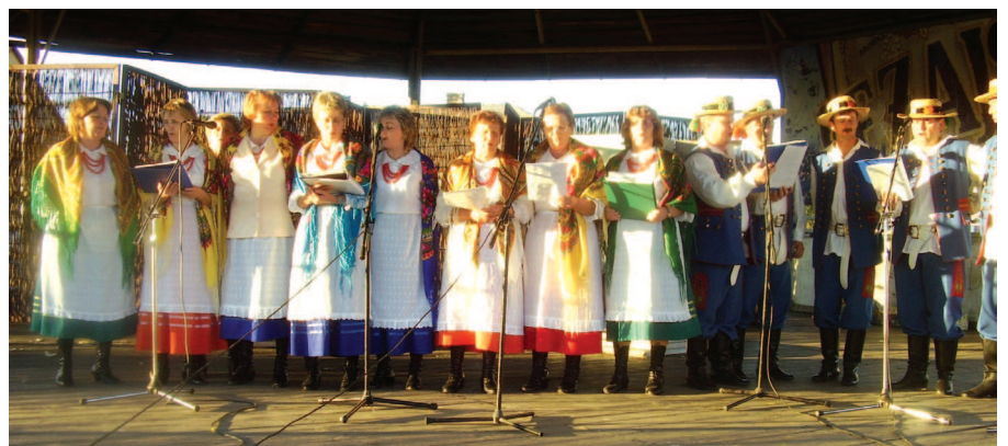
Zespół „Wierzawianie” z Wierzawic

Grupie Żywiec S.A. Browar Leżajsk (sponsor główny), Wójtowi Gminy Leżajsk, Starostwu Powiatowemu w Leżajsku, ZPOW Poltino Sp. z o.o. w Leżajsku, GS – Leżajsk oraz Drukarni POLIGRAF w Leżajsku