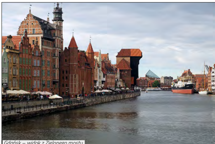
Gdańsk – widok z Zielonego mostu.

Jak Sopot to Monciak, czyli ulica Bohaterów Monte Cassino. To chyba obok Krupówek, najsłynniejszy deptak w Polsce. O każdej porze roku przyciąga tłumy turystów. Kto by pomyślał, że na początku XVII w. popularny teraz Monciak, był gruntową drogą łączącą Górny Sopot z chatami rybackimi na wybrzeżu. Jeszcze lody, krzywy domek i jedziemy dalej. Cel: najdalej na północ wysunięty punkt Polski. Po drodze spotykamy się z wieloma gestami sympatii. Wyciągnięty kciuk, stał się symbolem naszej wyprawy. O dziwo, nasze Małuchy, nie przeszkadzają ni-