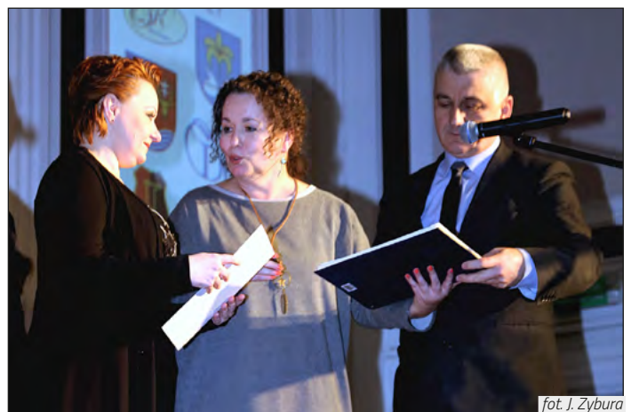
fol. J. Zybura

Kultury w Rzeszowie, SL „Witryna”, Miasto Stalowa Wola, Nadsański Bank Spółdzielczy – Oddział w Nowej Sarzynie, Ośrodek Kultury oraz Miejska i Gminna